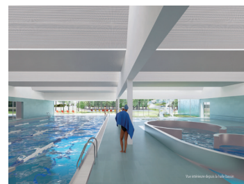
Le bassin de loisirs comportera une rivière dynamique.