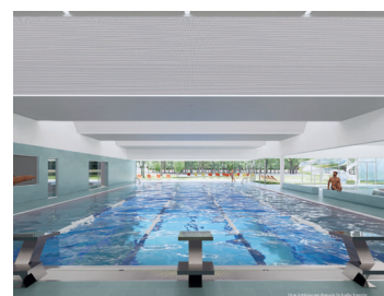
Le bassin de 25 m avec 5 couloirs