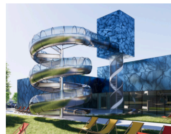
Le toboggan avec une partie Fae vitrée sera visible de l'extérieur.